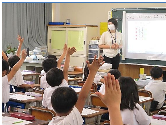
（1年）発表の仕方が身につきました

令和になり、周りの環境は刻々と変化しています。10年～15年後、今の小学生が社会人になった時、どのような仕事に就いているのか、なかなか予想ができていない現状です。しかし、子どもたちには、その時代の中で自分の目標や志に合う生き方を選んでほしいと願います。そのために必要な力は、義務教育9年間で培う基礎的な学力であり、周りの人たちとのコミュニケーション力であり、様々な困難を乗り越えていくたくましさや自立しようとする力だと思います。