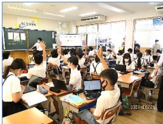
（6年）タブレットPCを使って

20分という限られた時間でしたので、お子さまの発表など活躍する機会に巡り会えなかったかもしれませんが、姿勢良く学習することや先生や友達の話聞くこと、そして、一生懸命書いたり作業したりする姿をご覧いただけたのではないのでしょうか。