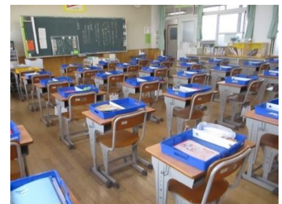
△ 児童机は間隔を空けて配置